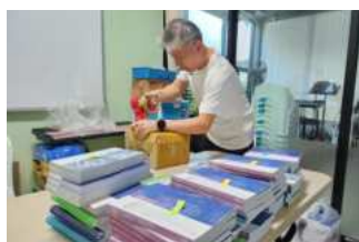
태국어 큐티인 사역