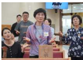
대구채플 새가족 환영 시간