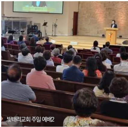
빛내리교회 주일 예배2