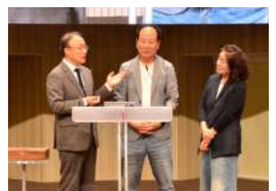
광주채플 자기소개 시간