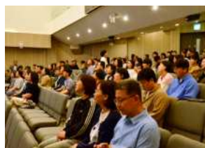
광주채플 예배 시간