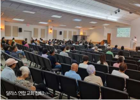
달라스 연합 교회 집회1