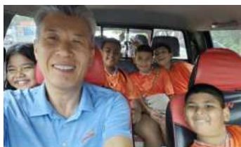
폰디교회 토요 학교 사역

10년 동안 함께 동역해 주신 성도님들께 깊은 감사 인사를 올립니다. 앞으로 시간도 주셔서 지켜 주실 줄 믿으며 선교 소식을 마칩니다.