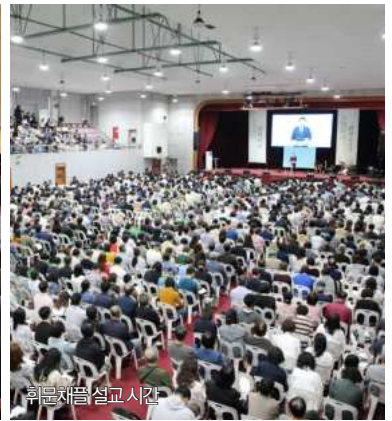
희문재음 설교 시간