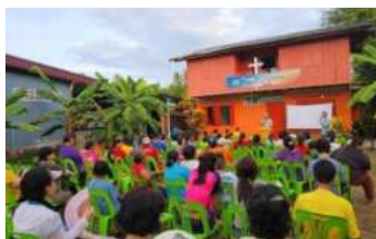
반던 교회 예배