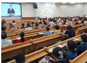
대구채플 예배 시간