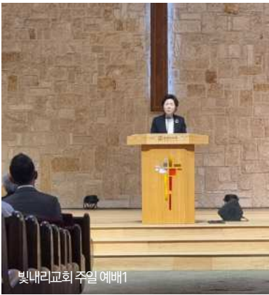
빛내리교회 주일 예배1