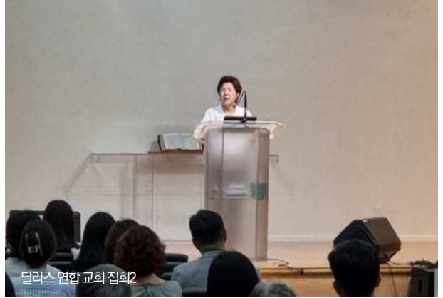
달라스 연합 교회 집회2